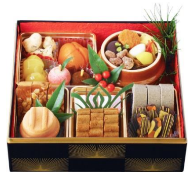
荻野屋 [B2F] 荻野屋/ドルチェ・エスタシオンの 「スイーツおせち」