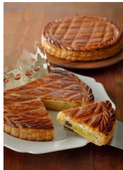
ル・ブーランジェ・ドゥ・モンジュ [B2F] ガレット デ ロワ