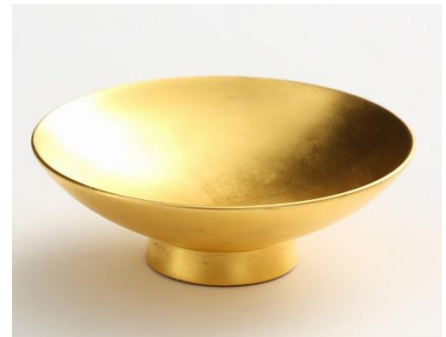
漆器 山田平安堂 [4F] 平盃 金箔