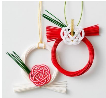
CIBONE CASE [4F] TIER お飾り