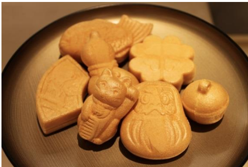
KUGENUMA SHIMIZU [B2F] KUGENUMA SHIMIZU もなか 福