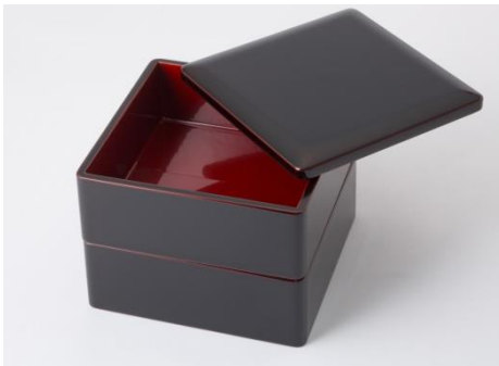
中川政七商店 [4F] 漆琳堂 お重