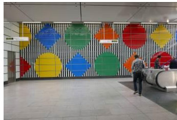
《四角と円》恒久設置、トッテンハム・コート・ロード駅、ロンドン、イギリス、2008-2017年 G1226