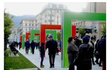
《歩く》展示風景、恒久設置、ヴェルディ・広場、ラ・スペツツィア、イタリア、2016年 © DB - ADAGP, Paris & JASPAR, Tokyo, 2018 G1226