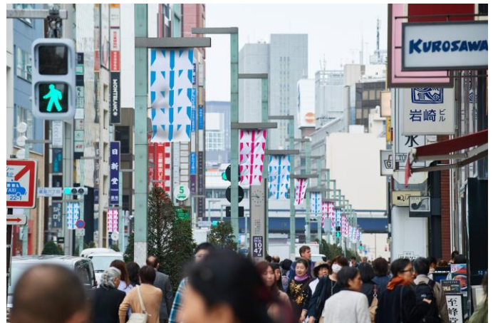
GINZA SIX 中央吹き抜けの新作インスタレーションと連動したアート作品を全長1,100メートルの銀座・中央通りに展示(イメージ)

《Like a flock of starlings: work in situ》Daniel Buren 2018 © DB - ADAGP, Paris & JASPAR, Tokyo, 2018 G1226