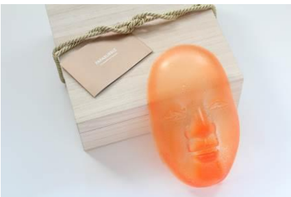
PAPABUBBLE [B2F] 飴で作った能面桐箱入り 4,630 円