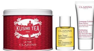
CLARINS [B1F] 紅茶とスキンケアのセット 6,500 円