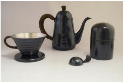
玉川堂 [4F] コーヒーポット(700ml) 170,000 円 コーヒーストッカー(100g)スプーン付 60,000 円 ドリッパー 35,000 円