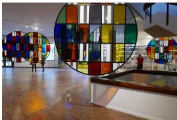
《半円から円へ: 色彩の旅》展示風景、ボコタ近代美術館、ボコタ、コロンビア、2017年 © DB - ADAGP, Paris & JASPAR, Tokyo, 2018 G1226