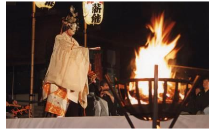
※上記は薪能のイメージ写真であり、実際の公演内容とは異なります。

※参加条件等の詳細は後日GINZA SIX公式WEBサイトにてお知らせいたします。