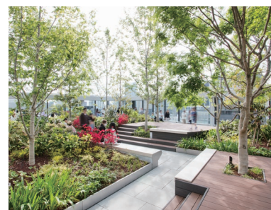
GINZA SIX ガーデン(屋上庭園)