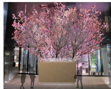
銀座三越 晴海通り口