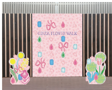
松屋銀座 8階MGテラス