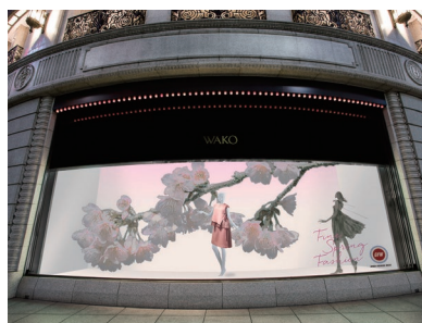
和光 本館ショーウィンドウ