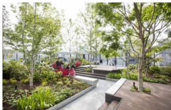
GINZA SIX ガーデン(屋上庭園) [屋上]

館内各所で、春を楽しむイベントを開催。屋上庭園では、彼岸の頃に開花する「エドヒガンザクラ」が楽しめます。銀座 蔦屋書店では、江戸の花見文化を「食」「ファッション」の切り口で紹介するイベントを開催、また、開業以来注目を集めた草間彌生のアートインスタレーションは3月21日(水・祝)まで展示します。