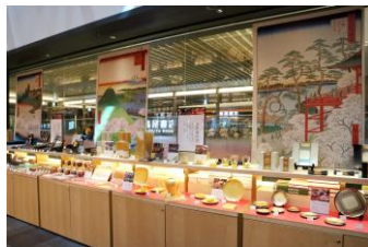
「江戸のお花見」フェア 3月31日(土)まで 銀座 蔦屋書店 [6F]