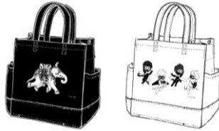
「マルシェバッグミニ」 各 6,800 円(税抜) 予定