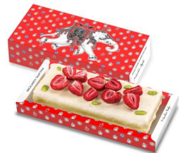
「ミルフィーユ フレーズピスターシュ」 4,000 円(税抜)