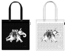
「トートバッグ」 各 3,800 円(税抜) 予定