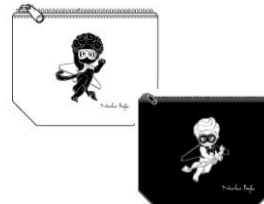
「ポーチ」(2個セット) 3,800 円(税抜) 予定