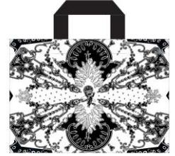
「ニコラ・ビュフ×銀座 蔦屋書店 オリジナルトートバッグ」 価格未定