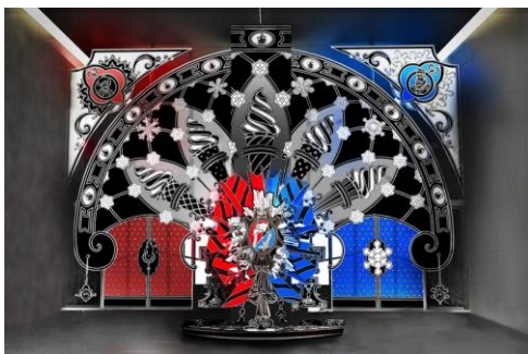
4丁目側エントランス

銀座中央通りに面した正面エントランス(2箇所)には、「夏の王国」と「冬の王国」のゲートが出現します。