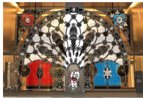
7丁目側エントランス

物語が長く受け継がれたことを象徴するモニュメント。物語の全ての要素が一つになっています。