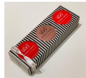
ホワイトデーセレクション 3缶セット (BETJEMAN & BARTON)

※上記は一例。各テーマのピックアップ商品は次項以降を参照 ※各店舗のメニュー・フード詳細および販売期間は、 別紙「ホワイトデーのおすすめメニュー・商品リスト」参照