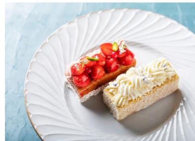
ベリーベリー ※画像左 (パティスリー パプロフ)