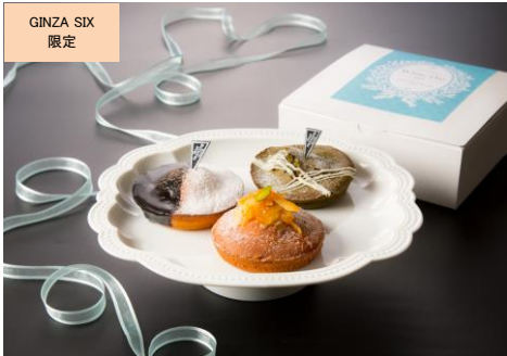
しっとりマドレーヌ 3個セット (Viennoiserie JEAN FRANCOIS) 価格:800円

※ギルトフリー：“身体に良い素材”や“低糖質・低カロリー”など、「罪悪感ゼロ」で楽しむことができる注目のフード