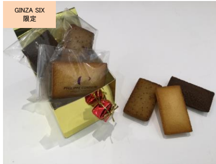
フィナンシェ ギフトボックス(3 個入り) (PHILIPPE CONTICINI)