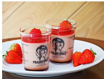
ストロベリーチーズプリン (マーロウ)