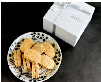
Dacquoise Assoties Set (PALETAS)