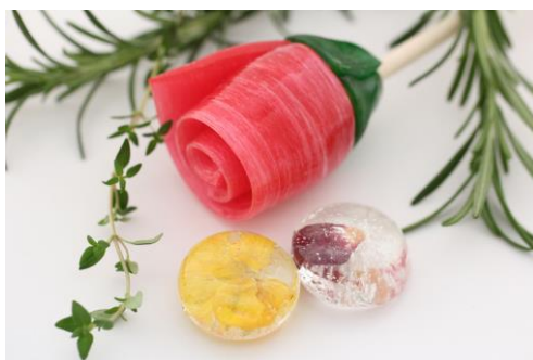
フラスワースーツセット (PAPABUBBLE)