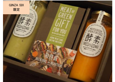
酵素ドレッシングのアソートボックス (meat & green 旬熟成) 価格:2,500円(2本セット)

あまおうそのものから作ったお酢に果汁とはちみつのみを加えた、ギルトフリーで健康的な飲む酢です。