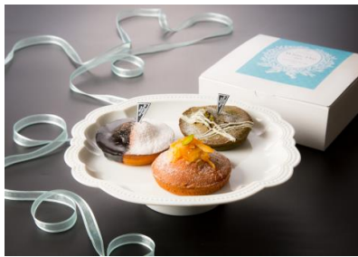
しっとりマドレーヌ 3個セット (Viennoiserie JEAN FRANCOIS)