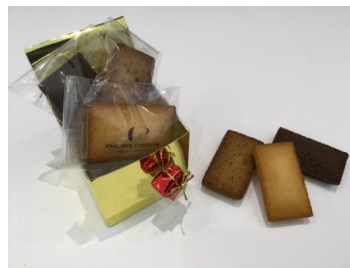
フィナンシェ ギフトボックス 3個入 (PHILIPPE CONTICINI)