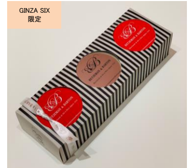
ホワイトデーセレクション 3 缶セット (BETJEMAN&BARTON)