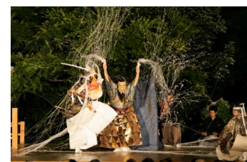
※薪能公演イメージ