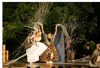
※写真はイメージであり、演目内容は異なります。

※主催:GINZA SIX リテールマネジメント株式会社/共催:一般社団法人観世会