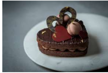
クールショコラ (パティスリー パブロフ) 価格:2,800円

アルノー・ラエール パリの新作コフレ「コフレ・オ・トレゾール」。日本限定の新作フレーバーと、オリジナルのボンボンショコラ25個入りのアソート。<宝箱>と名付けたゴージャスなコフレは、アルノー・ラエール パリの珠玉のボンボンショコラを存分にお楽しみいただけます。ご自身へのご褒美にも、大切な方への贈り物にもおすすめです。