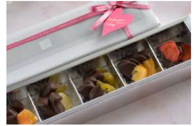
綾プラチナムショコラ (綾farm) 価格:3,500円

バレンタイン限定のハート型ホールケーキです。チョコレートクリームをチョコレート生地ですاندし、ハート型のチョコレートやマカロンを添えて、華やかに仕上げました。