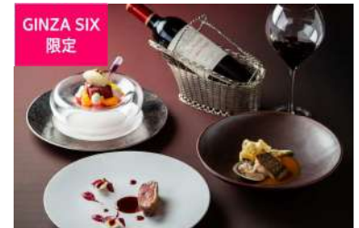
バレンタイン特別コース (THE GRAND GINZA)[13F] 価格:10,000円

第四のチョコレートとして人気の「ルビーチョコレート」と例年人気の苺づくしのアフタヌーンティーをご用意しました。バレンタイン・ホワイトデー期間限定で、シャンパンにパティシエ特製の甘く、口に含むと食感が楽しいお菓子を浮かべた特別なシャンパンをプレゼント。ノンアルコールもご用意しています。