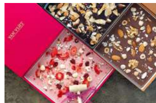
ヴァンヴリット ハンマー付き オーガニックチョコレートタブレット (ダーク・ミルク・ストロベリー) (ビオセボン) 価格:各1,944円