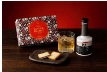
サク(ラング・ド・シヤ) (ウイスキー) (ISHIYA G) 価格: 1,566円

FRANCK MULLER PÂTISSERIEオリジナルのお猪口に、口溶け滑らかな生チョコレートが入った「大吟醸シヨコラ」が登場。バランスに優れたベルギー産クーベルチュールの深いコクに「FRANCK MULLER純米大吟醸」の豊かな香りが合わさった、大人のための贅沢なスイーツです。