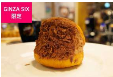
ドモリー社チョコレートのマリトッツォ (EATALY) [6F] 価格: 480円

チョコレートクリームをたっぷり挟み込んだ人気スイーツマリトッツォや、口の中でシュワッととろける淡雪にラング・ド・シヤを重ねたストロベリー味のサンドや、オーガニックチョコチップとアーモンドがアクセントになったチーズバターサンドなど、見た目もかわいいサンド系スイーツは日ごろのお礼にぴったりです。