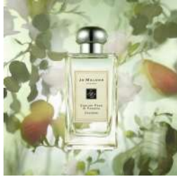
イングリッシュ ペアー & フリージア コロン (Jo Malone London)[2F] 価格:18,150円

大切なパートナーへ渡すギフト選びは悩ましい中、昨今人気のフレグランスアイテム。その中でも性別を問わず、男女ともに使いやすい、パートナーや夫婦でシェアできると人気急上昇しているジェンダーレスな香りの香水やアロマキャンドルがおすすめです。