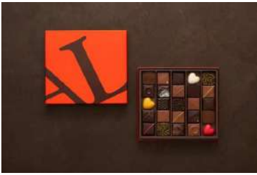
コフレ・オ・トレゾール (アルノー・ラエール パリ) 価格:9,180円

アルノー・ラエール パリの新作コフレ「コフレ・オ・トレゾール」。日本限定の新作フレーバーと、オリジナルのボンボンショコラ25個入りのアソート。<宝箱>と名付けたゴージャスなコフレは、アルノー・ラエール パリの珠玉のボンボンショコラを存分にお楽しみいただけます。ご自身へのご褒美にも、大切な方への贈り物にもおすすめです。