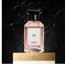
レ マティエール コンフィダンシエル オーデリ (La Boutique Guerlain)[B1F] 価格:21,450円

天然の蜜蝋、菜種蝋、ココナツ蝋に、ミツバチが好む花やハーブの繊細な香りを加えて、一つ一つ丁寧に手作業で蝋を注いで作られたアロマキャンドル。プチグレンの香りには、心を落ち着かせ穏やかにし、明るく前向きな気持ちに導く効果があるといわれています。燃焼時間は約50時間。