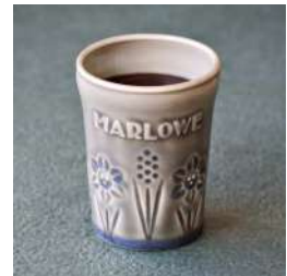
アイリッシュウイスキー生チョコレート (マーロウ) 価格: 1,869円

国際的な酒類コンペティションSFWSC最優秀金賞受賞の北海道・厚岸カムイウイスキー「サロルンカムイ」を配合したミルクチョコレートを、プレーンなラング・ド・シヤでサンドしました。チョコレートのコクの中にウイスキーの風味を感じる、ちょっぴり大人な味わいの一品です。