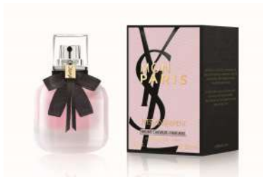
モン パリ ヘアミスト (YVES SAINT LAURENT BEAUTÉ)[B1F] 価格:6,600円

優美なフローラルアロマの中に女性らしさを解き明かします。ベースにバラのつぼみ、鮮やかに輝くフリージア、そして甘いホワイトムスクを組み合わせた、みずみずしい花たちの美しい香りです。力強く、斬新かつ印象的なこのフレグランスに、クラシックで気軽に身に付けられるフローラルの香りをより繊細で魅力的に仕上げました。