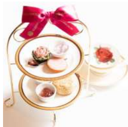
ローズアフタヌーンティー (食べるバラの専門店・玖島ローズ) 価格:1,980円

本物のバラを使用したスイーツや、ルビーチョコレートと苺づくしのアフタヌーンティー、ハートのラベルの素敵な味わいのグラス赤ワイン付きバレンタイン特別コースなど、コロナ禍で会う機会が少なくなっていた昨今、パートナーや友達と一緒に満喫したいメニューをご用意します。