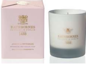
RATHBORNES 1488 ボタニカル ビー コレクション ジャスミン&プチグレン (Gluxury)[B1F] 価格:7,700円

穏やかな灯りと香りで2人の時間を彩るキャンドルや、枕カバーやシーツに吹きかけて、ベッドルームを心地よい空間にしてくれるフレグランスやミストなど、2人が癒されるアイテムを取り揃えました。