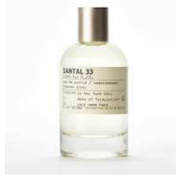
SANTAL 33 eau de parfum (LE LABO)[1F] 価格:50ml 23,650円/100ml 34,650円

秋のエッセンスを凝縮したかのよう。英国の果樹園で収穫した熟した洋梨の官能的なみずみずしさを白いフリージアのブーケで優しく包み、アンバー、パチョリ、ウッドで豊潤に仕上げています。