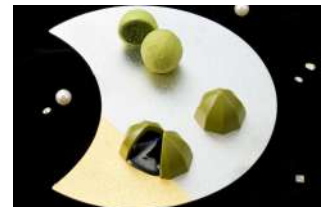
宇治茶ボンボンアソート (くろぎ茶々) 価格:3,888円

※上記は一例です。各店舗の商品の詳細および販売期間は別紙「バレンタイン・ホワイトデーのおすすめグルメ商品リスト」をご参照ください。 ※掲載内容は変更になる場合がございます。 ※価格は全て税込です。 ※画像はイメージです。 ※フロア記載がない店舗は全てB2Fになります。