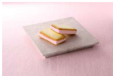
本実堂サンド ストロベリー 4個入 (HONMIDO) 価格: 980円

カカオの栽培から焙煎、生産までこだわったドモリー社のチョコレートを使ったクリームをたっぷり挟んだマリトッツォ。ビターチョコレートの芳醇で洗練された味わいをご堪能ください。