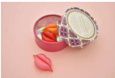
くちびるキャンディ (キャンディアートミュージアム by PAPABUBBLE) 価格:540円

綾farmのドライフルーツの中から厳選された5種類のフルーツ(洋梨、キウイ、レモン、いちご、マンゴー)をビターチョコレートでディップし、上品に仕上げました。ドライフルーツの酸味、甘味とビターチョコレートのほろ苦さのハーモニーは贅沢なひとときを演出します。 ※マンゴー欠品後は、白桃に変更となります。