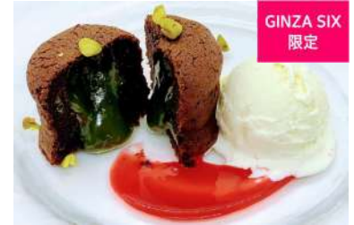
フォンダンショコラ・ピスターシュ (ビストロ オザミ)[6F]

イタリア語で「貴婦人のキス」と呼ばれる北イタリアの郷土菓子で、マカロンの原型になったといわれています。G20大阪・G7伊勢志摩の両サミットで日本政府が各国首脳のおもてなしに提供した「バーチ・ディ・ダーマ」。濃厚なピスタチオペーストを贅沢に練りこみ焼き上げた人気のピスタチオフレーバーをお楽しみください。