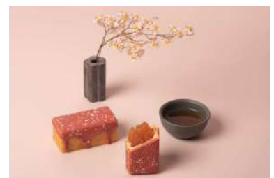
いちごりんごケーキ (SunnyHills ginza) 価格:2,400円

苺牛乳を連想させる苺飲料とふわふわとしたマシユマロ、苺のマカロンで作られた三位一体の乙女心を掴むフラペチーノです。