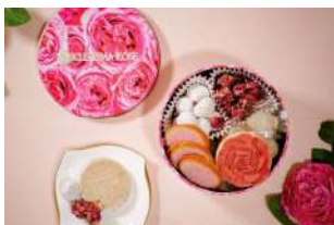
プティフルセック ローズ街 (食べるバラの専門店・玖島ローズ) 価格:3,240円

昨年好評だった「いちごりんごケーキ」が期間限定で新発売。青森県産の紅玉りんごを使ったりんごケーキに、フランスの老舗ショコラブランド「ヴァローナ」のストロベリーチョコレートをたっぷりとかけた春らしいケーキです。ピンク色の華やかな装いはギフトにもぴったり。