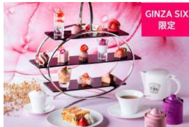
ルビーチョコレートと苺づくしのアフタヌーンティーセット Valentine&white Dayバージョン (THE GRAND GINZA)[13F] 価格:6,292円

銀座でバラのティータイム。ジャム、スコーン、バター、カップケーキなどのスイーツにもすべてに本物のバラを使用しています。ローズスパークリング(ノンアルコール)&バラ茶ともにお楽しみください。