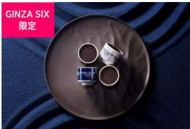
大吟醸シヨコラ 2個入り (FRANCK MULLER GENEVE) [2F] 価格: 5,076円

オリジナルのお猪口の中に、口溶け滑らかな生チョコレートが入った「大吟醸シヨコラ」や、ウイスキーの風味を感じるラング・ド・シヤや生チョコレートなど、大人のための贅沢なスイーツを取り揃えました。