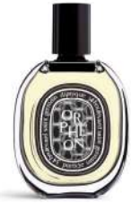
オードパルファン オルフェオン (diptyque)[B1F] 価格:23,100円

世代と性別を超えて愛されるアイコン的パフューム。インスピレーションソースは、一人のカウボーイが広大な空の下、馬に寄りかかり優雅にタバコをふかしている光景。そんな“マールボロ”の古いポスターの光景にある、古き良きアメリカのファンタジーからインスパイアされた魅惑的な香りで構成されています。