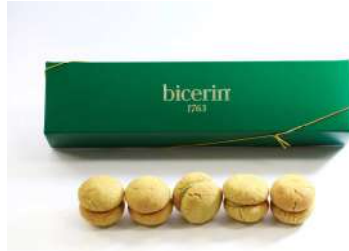
バーチ・ディ・ダーマ(ピスタチオ) (Bicerin) 価格:1,350円

NAGASHIKAKUは温度変化を楽しめる、大人のためのテリーヌブランド。長方形型のチョコレート菓子は、冷凍しても硬くなりすぎず、程よい硬さをお楽しみいただけます。凍らせて、冷やして、溶かして、温度変化とともに変わる食感を味わえる特別なテリーヌです。