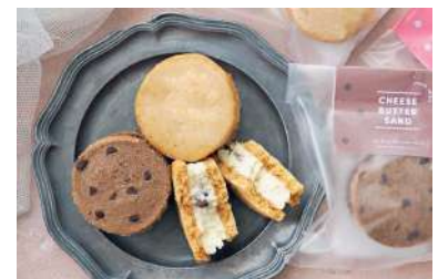
チーズバターサンド (オーガニックチョコアーモンド) (ビオセボン) 価格: 430円

淡く優しい食感の淡雪に、うすく焼き上げたラング・ド・シヤを重ねた「本実堂サンド」。季節限定の甘酸っぱいストロベリー味は今だけのお味。サクッとしたラング・ド・シヤとお口の中でシュワッととろける淡雪の食感をお楽しみいただけます。