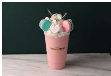
ストロベリーマカチーノ (TOKYO MACAPRESSO) 価格:840円

くちびるロリポップがプチギフトにぴったりなミニサイズで新発売。蓋を開けた瞬間、どきどきするかわいさだけでなく、しっかり美味しく召し上がれるキャンディに仕上げました。「いちご(赤)」「ピーチ(ピンク)」「オレンジ(オレンジ)」のフレーバーをお楽しみください。