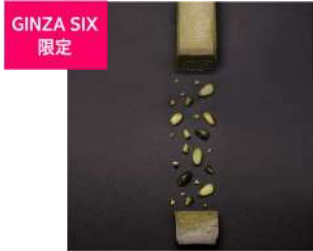
NAGASHIKAKU PISTACHIO (T's GALLERY) 価格:2,376円

温度変化とともに変わる食感を楽しめるテリーヌや、温かいフォンダンショコラからとろ〜りと流れるピスタチオのガナッシュなど、色鮮やかで濃厚な味わいが人気の「ピスタチオ」フレーバーのチョコレートスイーツが取り揃います。