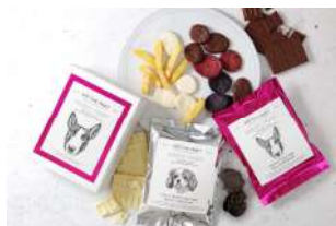
SPECIAL GIFT BOX (AND THE FRIET) 価格:1,600円