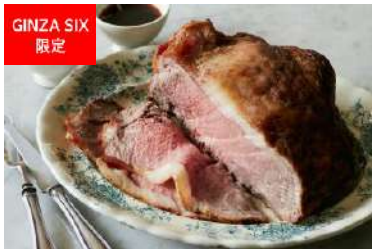
シェフ特製ローストビーフ (THE GRAND GINZA) [13F] 価格:1kg 5,000円

ホームパーティーの主役にふさわしい存在感のある塊肉の特製ローストビーフは、お気に入りの大皿に盛り付けてテーブルの中央に配して。しっとり柔らかな肉の旨味を引き立てるのは、西洋わさびとシャリアピンという2種のソース。