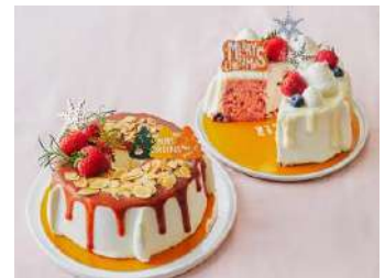
クリスマスシフォンケーキ (MERCER bis GINZA) 価格:(左) 4,300円 (右) 4,800円

森の恵みによる繊細で複雑な味わいが魅力の洋菓子専門店。果物や木の実などをふんだんに使ったプディングは、自然な甘みや風味が織りなす独特のハーモニーが口福をもたらす。