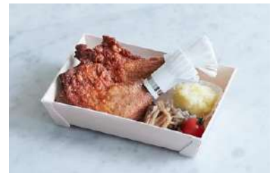
銀座の鶏もも(クリスマス限定バージョン) (荻野屋) 価格:鶏もも2本、付け合わせ付き 1,620円

パリで100年以上続くビストロ料理と日本の正統派洋食をコンセプトに、トラディショナルスタイルの料理を提案する「ビストロ オザミ」。フランスの食文化から生まれたシャルキュトリーの盛り合わせは、シャンパンやワイン、チーズと一緒に楽しんで。