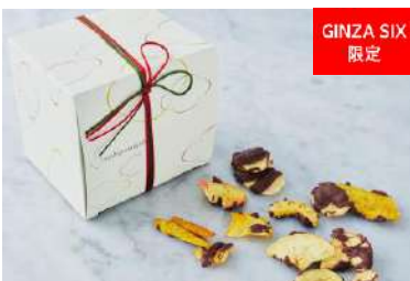
果物チップス限定チョコ (麻布野菜菓子) 価格:85g 864円

定番人気の“果物チップス”が、クリスマスの期間限定でほどよい甘さのミルクチョコをまとって登場。