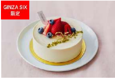
ルージュブラン (T's GALLERY) 価格:4,500円

月に1日しかオープンしない大阪にある完全予約制スイーツ専門店「ツキイチ」。予約のとれない店の“ルージュブラン”を特別にアレンジした一品は大切な人と過ごす日を彩ってくれる。