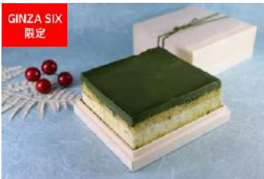
白練 宇治抹茶ケーキ (くろぎ茶々) 価格:3,780円

米粉を使用したグルテンフリーのタルトに、カスタードクリームとフルーツをたっぷり飾りつけて。ゴロゴロとした大きなフルーツは食べ応えもあり、甘いものが苦手な人にもおすすめ。