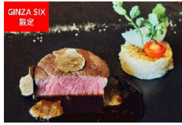
THE GRAND 47Christmas Dinner (THE GRAND GINZA) [13F] 価格:21,780円(サービス料込み)

イタリアの食文化を発信しているイタリー銀座店内「ラ・グリーリア」では、クリスマス限定の前菜と、北イタリアの伝統的なパスタであるトリュフのタヤリン、メインディッシュに短角牛のフィレ肉と北海道産の鴨胸肉のグリルをご用意。ドルチェやエスプレッソまで、本場のイタリアを感じられるスペシャルなコースを召し上がれ。