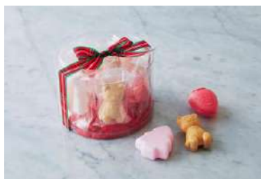
クリスマスもなかBOX (KUGENUMA SHIMIZU) 価格:8個入り 2,160円

定番人気の“果物チップス”が、クリスマスの期間限定でほどよい甘さのミルクチョコをまとって登場。