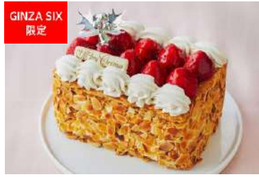
クリスマス仕様の苺のミルフィーユ (THE GRAND GINZA) [13F] 価格:6,480円

月に1日しかオープンしない大阪にある完全予約制スイーツ専門店「ツキイチ」。予約のとれない店の“ルージュブラン”を特別にアレンジした一品は大切な人と過ごす日を彩ってくれる。