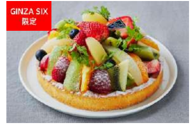
クリスマスタルト〜グルテンフリー〜 (Viennoiserie JEAN FRANÇOIS) 価格:3,780円

パリの老舗レストラン「マキシム」の支店として、銀座で約50年間親しまれてきた「銀座マキシム・ド・パリ」。そんな名店の“苺のミルフィーユ”を再現した人気ケーキがクリスマスの装いに。