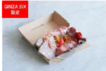
シャルキュトリー盛り合わせ (ビストロ オザミ) [6F] 価格:3~4人前 3,000円

ホームパーティーの主役にふさわしい存在感のある塊肉の特製ローストビーフは、お気に入りの大皿に盛り付けてテーブルの中央に配して。しっとり柔らかな肉の旨味を引き立てるのは、西洋わさびとシャリアピンという2種のソース。