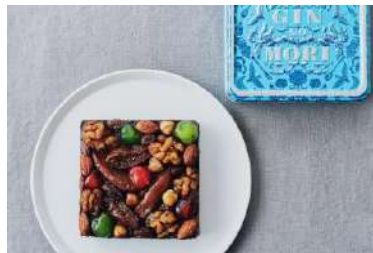
クリスマスプディング (パティスリー GIN NO MORI) 価格:2,700円

京都「福寿園」の厳選した宇治抹茶に、クリームチーズの酸味とホワイトチョコレートの甘みを掛け合わせて。旨み豊かな宇治抹茶と一緒に楽しみいただきたい、こだわりの一品。