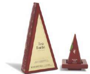
ウォーミングジョイ ティーツリー (Tea Forté) 価格:2,743円

クリスマスモチーフのもなかの皮に、チョコレート餡を別添え。いつでも作りたての香ばしさが味わえる。