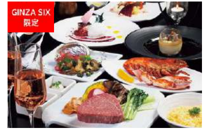
クリスマスコース (TEPPANYAKI 10 GINZA) [6F] 価格:25,000円

日本全国より取り寄せた冬の旬味をふんだんに盛り込んだ、本格フレンチの特別ディナー。前菜には北海道産雲丹のロワイヤルなども加わり、海山の幸をあますことなく味わうことができる。クリスマスのイルミネーションに煌めく銀座の街を見下ろすことができるロケーションで、ワンランク上の一夜を。