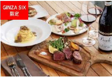
ナターレコース (EATALY LA GRIGLIA) [6F] 価格:10,000円

イタリアの食文化を発信しているイタリー銀座店内「ラ・グリーリア」では、クリスマス限定の前菜と、北イタリアの伝統的なパスタであるトリュフのタヤリン、メインディッシュに短角牛のフィレ肉と北海道産の鴨胸肉のグリルをご用意。ドルチェやエスプレッソまで、本場のイタリアを感じられるスペシャルなコースを召し上がれ。