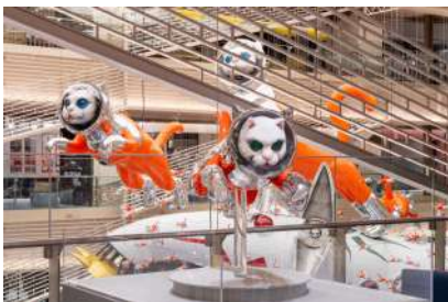
SHIP'S CAT (Flying)