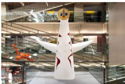
太陽の塔 Tower of the Sun (1/50)