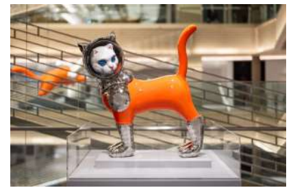
SHIP'S CAT (ONK-1)