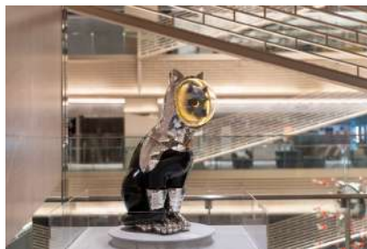
SHIP'S CAT (Crew/Black)