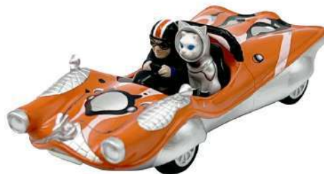
SHIP'S CAT (Speeder) / プルバックカー 4,400 円 (税込)