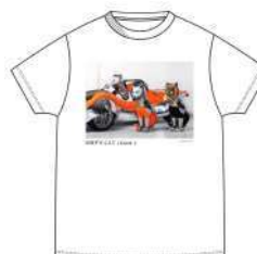
SHIP'S CAT (Crew) / T シャツ黒・白