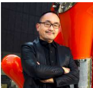
ヤノベケンジ プロフィール